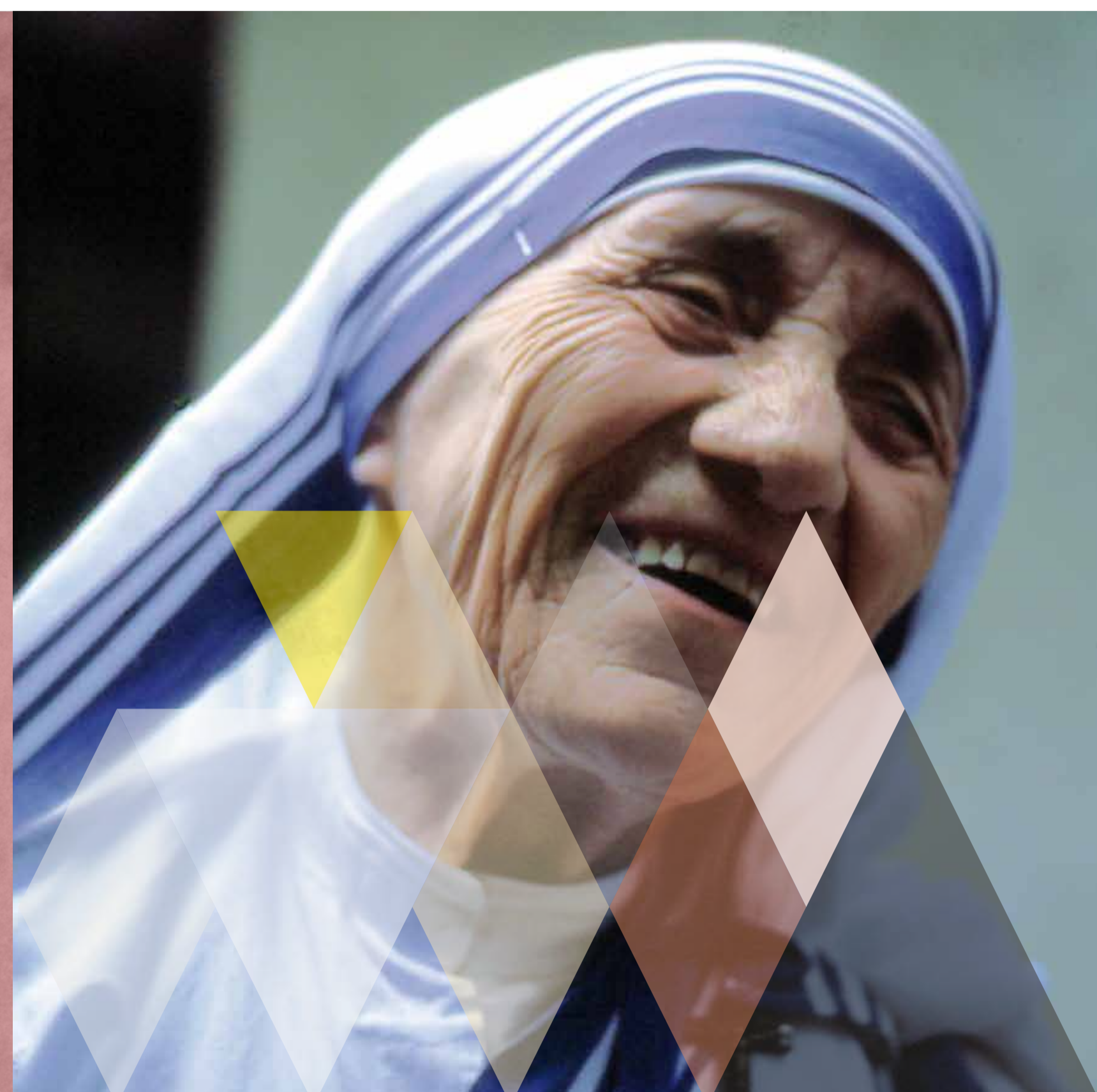
TERESA DE CALCUTA