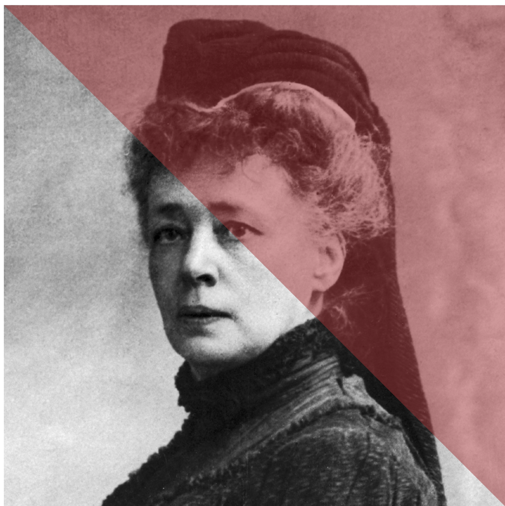
BERTHA VON SUTTNER